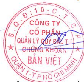
Bà Trần Đỗ Quyên